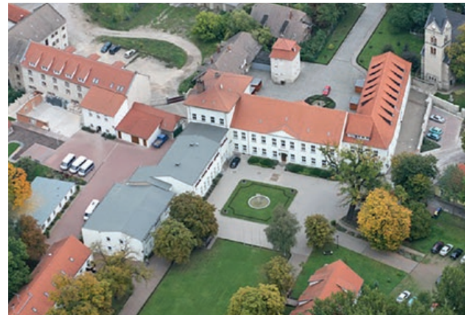
Standort in Rathmannsdorf aus der Vogelperspektive

Das BBRZ ist einer der größten Bildungsträger im Salzlandkreis.